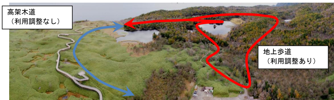
知床五湖利用調整地区における地上歩道と高架木道の位置関係