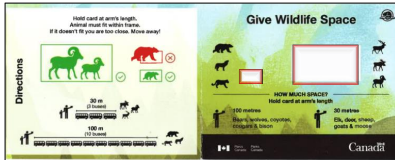
配布カードイメージ（図はカナダの配布カード）

カムイワッカ部会主催で実施予定の「降車禁止キャンペーン」チラシやカードの配布を知床五湖で行い、公園利用者の適正な自動車利用と野生動物との適切な接し方を啓発する。（実施期間未定）