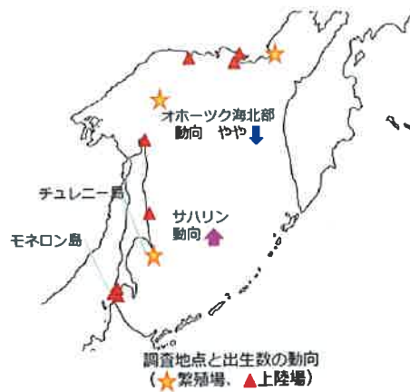
図7-4 繁殖場の状況