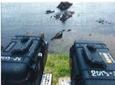
図7-3 カメラ設置場所から望むモネロン島上陸場