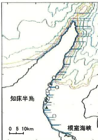
根室海峡調査測線とトド発見位置