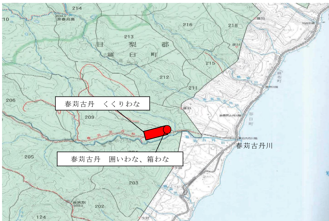
図2：遺産隣接地域におけるR1シカ年度エゾシカ捕獲事業実施地点（羅臼地区）