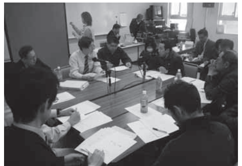
起草部会での議論

エコツーリズム戦略は、起草部会と呼ばれる地元関係者等の有志の会合において、ワークショップ形式でアイデアを積み上げて作られた。起草部会では、地域からの意見をホワイトボードや付箋に書き出し、関係者の意見が見えるように工夫をした。また、平成二三年度には具体的な文章案を広く地域に呼びかけて募集し、一〇〇件を超える文章案を地域から提案いただいた。それらをどのようにエコツーリズム戦略に反映させるかについて、起草部会での議論を踏