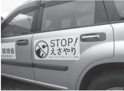
知床ヒグマエサやり禁止キャンペーンのステッカー

平成二四年度からこのポトムアップ型の体制に基づく議論を試行的に実施しているが、検討会議の資料の作成や説明を地域の関係者が担う時間が多くなり、検討会議の構造の変化が徐々に進んでいる。平成二四年度に実施された試行的な議論のうちの「知床ヒ