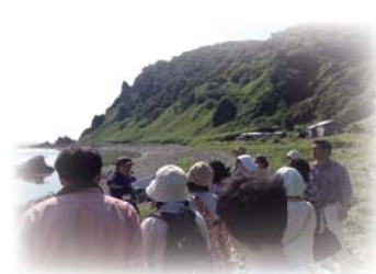
知床岬赤岩地区羅臼昆布エコツアー