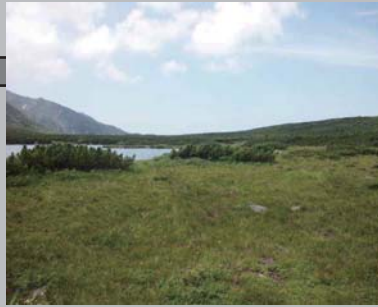
平成 27 年 8 月 4 日撮影