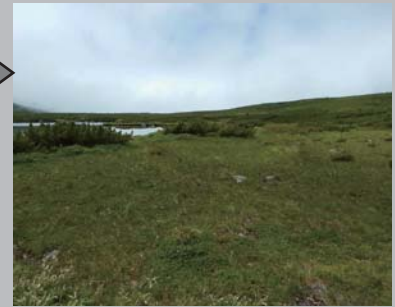
平成 28 年 7 月 13 日撮影