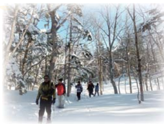
厳冬期の知床五湖エコツアー

エコツアー検討会議の主人公は、地域のみなさんです。「知床エコツーリズム戦略」(略して”エコツアー戦略”)は、知床の魅力を伝える為、「やりたいこと」「やるべきこと」を地域のみなさんからのアイディアによって、関係者で話し合い、形にするしくみです。