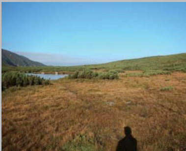
平成 26 年 9 月 15 日撮影