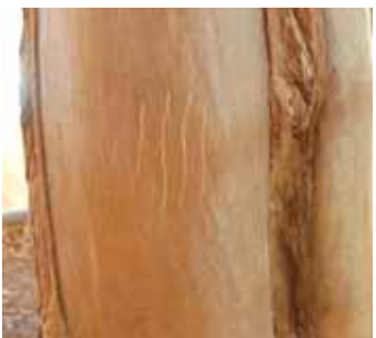
动物所留痕迹的模型(棕熊的爪痕等)