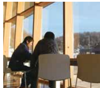
一边可以阅读有关知床的书籍等, 一边可以轻松休息的休息区