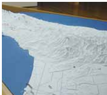
以1/25,000的缩小地形模型介绍知床的景点