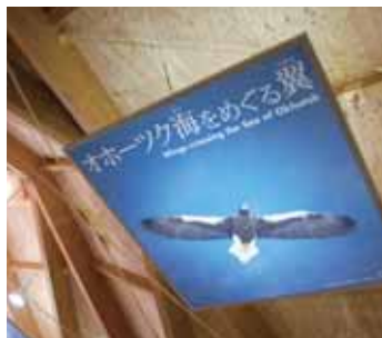
可以感受到木头温暖的空间

在知床世界遗产中心中,有以实物大小的照片展示棕熊或虾夷鹿等栖息在知床的动物,还有棕熊的爪痕等动物所留痕迹的模型。让大家在享受知床美好的大自然的同时,了解必须遵守的规则与礼貌。另外,也公布知床世界遗产的景点或大自然的即时信息,且同时提供管理知床世界遗产的最新信息。