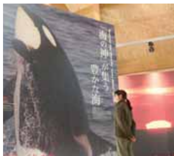
生物实物大小的大型照片壁板