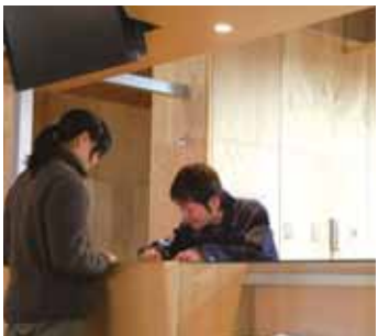
可以了解当季自然信息的信息处