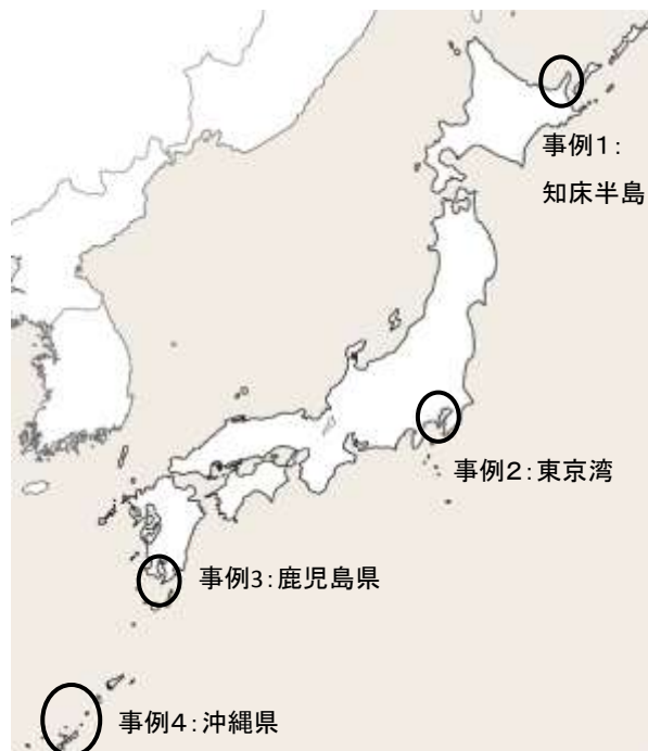
図2 自主的海洋保護区（AMPAs）の事例

される自主的海洋保護区（AMPAs）は、日本沿岸に多数（少なくとも数百カ所）存在している。以下、その典型例を4つほど簡単に紹介する。