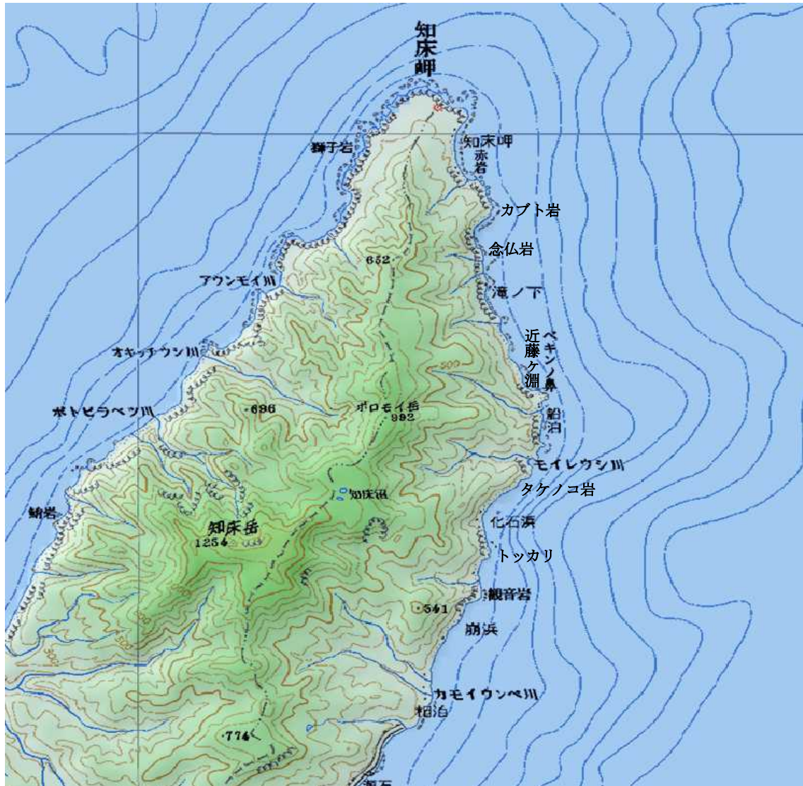
参考地図 知床半島先端部地区の地名